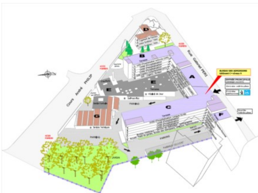
Figure 1 : Plan de masse du site

L'hôpital des Charpennes est situé sur la commune de Villeurbanne, et est composé de plusieurs bâtiments d'une surface totale de 18 700 m 2 (cf fig 1).